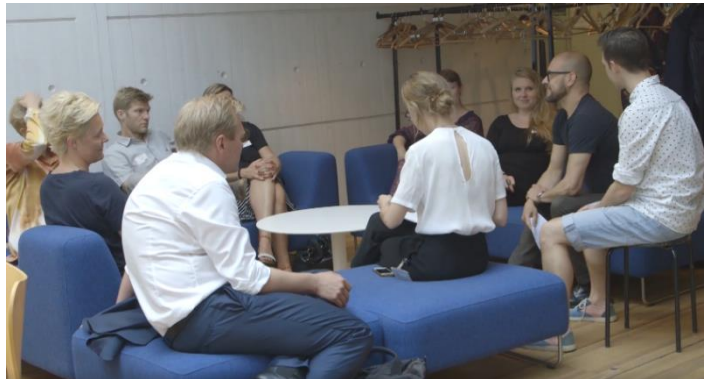
Første stop, A salens foyer, Gamle Scene

Vores erfaringer med de forskellige undersøgelser i A Suitcase of Methods har lært os, at de rum, vi mødes i med publikum, har stor betydning for den kontakt, vi har med dem, og den refleksion vi sammen kan have om vores kunstoplevelser. Derfor ønskede vi at arbejde aktivt og bevidst med rummene i vores design af workshoppen. Det gjorde vi ved at lave en guidet tur gennem teatret, hvor deltagerne kom igennem forskellige rum med meget forskellige kvaliteter og atmosfærer. Vi startede i et meget