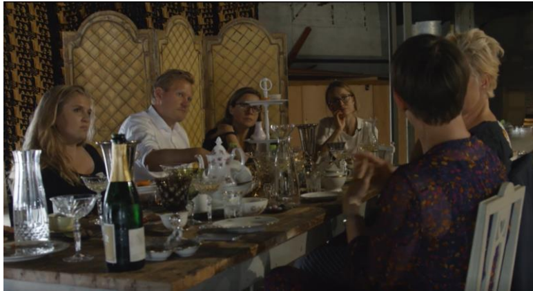
Kronloftet. Diskussionen er i gang.

resultat. Vi nåede ikke til en løsning på denne udfordring, men et ønske kunne være, at man begyndte at eksperimentere med, hvordan en teaterprøveproces også kunne se ud. Det ville i hvert fald være ærgerligt, at lukke muligheden for publikums feedback helt ned uden at afprøve flere metoder.