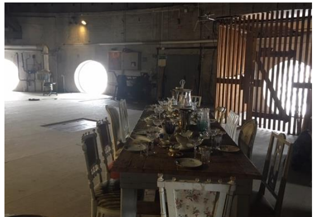
Kronloftet på Gamle Scene. Scenen er sat til den afsluttende diskussion.

lagde jeg op til diskussion ved igen at henvise til sårbarhed og relation som begreber, der også fremadrettet kan hjælpe kreative organisationer med at mødes om dette arbejde med publikumsfeedback. Dette argument er udfoldet yderligere i rapport #17