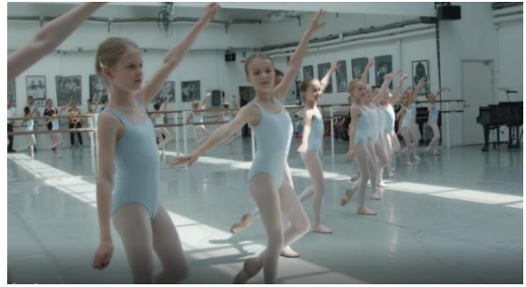
Åbne prøver. Balletbørn prøver på forestillingen Kom Bamse, nu balletter vi!

Efter en gennemgang af undersøgelserne skulle vi igen en tur ud på teatrets snørklede gange. Turen gik op på fjerde sal til endnu en prøvesal, hvor de unge balletskoleelever var startet prøver på forestillingen Kom Bamse, nu balletter vi!