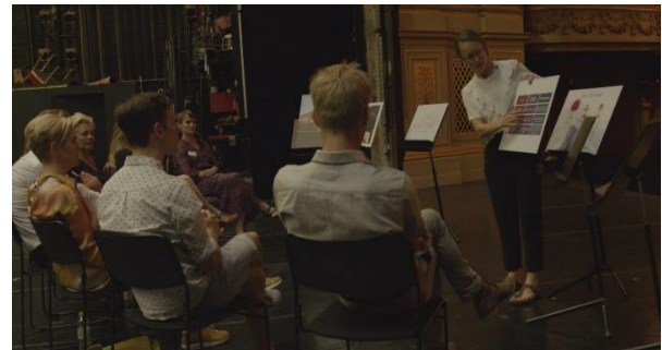
Vi præsenterer vores resultater på scenen på Det Kongelige Teaters Gamle Scene.

Herfra bevægede vi os ad den rodede men stemningsfulde bagscene med scenografi fra Kameliadamen , der stod klar til næste forestilling. Vi endte ude på scenen, der som rum betragtet i den grad er præget af en traditionel, romantisk teateræstetik, ligesom den måske imponerer og vækker respekt. Som det fremgår af billedet til højre havde vi her lavet et setup, hvor udvalgte projekter blev formidlet i en kort mundtlig præsentation. 2